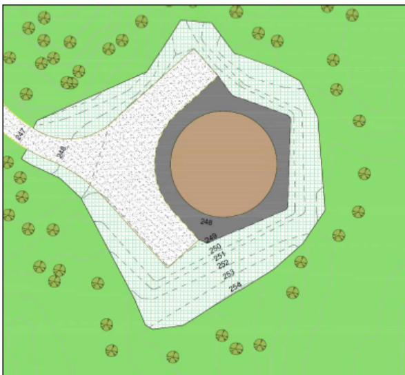
Figur hentet fra planbeskrivelse av 08.02.2022. Figur 4

Forslagsstiller ved teknisk drift ønsket planområdet utvidet etter offentlig ettersyn med ca. 650 kvm mot nordøst, for å legge til rette for å etablere to bassenger i området, som vist av figur nedenfor.